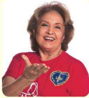
Eva Wilma Atriz

“Eu sempre gosto de estar perto de crianças. Sem Educação, não se sabe como vamos lidar com o alimento, porque existe o plantio. Sem Educação, não sabemos como vamos lidar com a saúde. Desejo que o trabalho da Legião da Boa Vontade continue exatamente assim e cada vez conseguindo melhores resultados.”